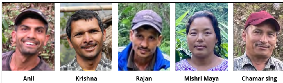
✓ Een deel van het Nepalese team